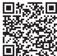
Google Play Store

Um das Gerät mit der Casambi-App verwenden und parametrieren zu können, muss es einem Netzwerk hinzugefügt werden.