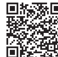
Google Play Store

To be able to use and parameterize the device with the Casambi app, it must be added to a network.